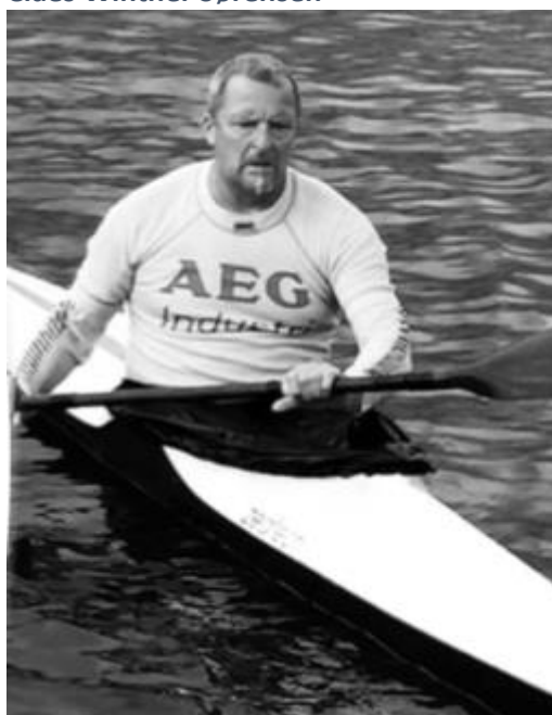
SK handicap resultat 2021